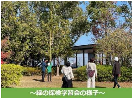
～緑の探検学習会の様子～

https://www.minnanomoripj.org/zukan_map/zukan_map-23582