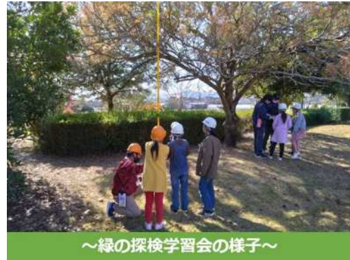
～緑の探検学習会の様子～